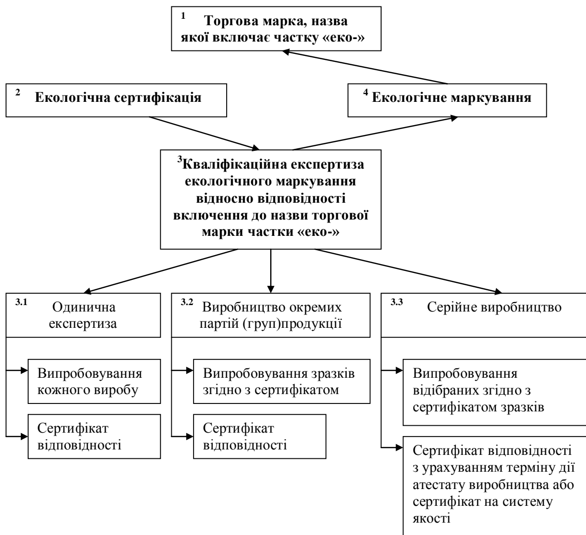
Рис. 3.1 Доповнення процедури сертифікаційного маркування органічної продукції (розроблено автором)

органічної продукції на території регіонів України, що сприятиме економічному піднесенню на основі більш повної реалізації внутрішнього ринкового потенціалу України та значному підвищенню використанню наявних конкурентних переваг України як на внутрішньому, так і на зовнішньому ринках.